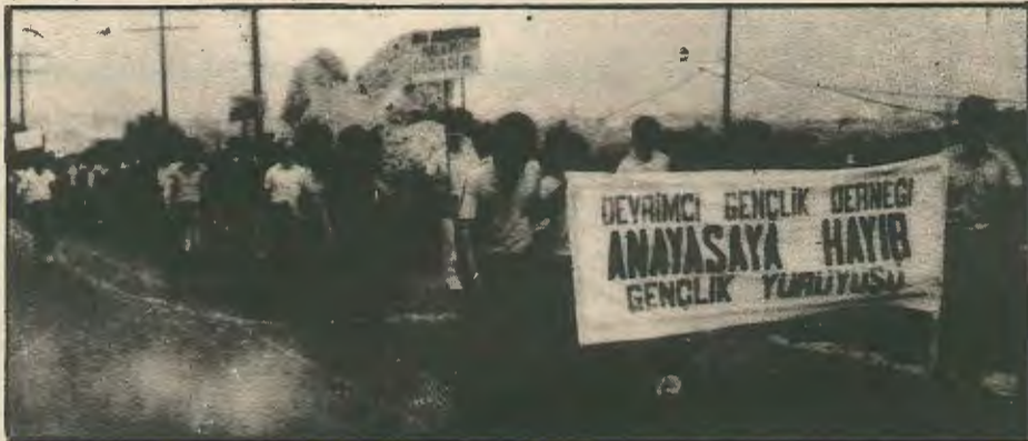
Απο την πορεία διαμαρτυρίας ενάντια στο σύνταγμα που οργάνωσε η Επαναστατική Νεολαία στες 21 Απριλή.

οι νεολαίοι της Καρπασίας αναγκάζονται να διανύουν 150 χλμ. κάθε μέρα πηγαίνοντας στη Μόρφου για να δουλέψουν στο μάζεμα των πορτοκαλιών. Οι εργάτες αυτοί, που στην πλειοψηφία τους είναι 15-20 χρόνων, δουλεύουν 10-12 ώρες την ημέρα και αμείβονται με 2.000 Λ.Τ. (2.50 Λ.Κ.). Αρκετοί απ' αυτούς για να αποφύγουν την καθημερινή ταλαιπωρία και τα έξοδα αναγκάζονται να μένουν σε ερημωμένα σπίτια στη περιοχή Μόρφου, χωρίς νερό,